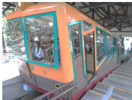
【ケーブルカーに乗車！】

※と・らいずなかもが主催で、毎月様々なイベントを開催しています。ご希望の方には、毎月イベントのご案内をメールにて送らせていただきます。ご興味のある方、詳細を知りたい方は、と・らいずスタッフまでお気軽にお問い合わせください